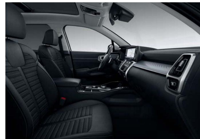
ŠTANDARDNÁ ČIERNA TKANINA (PRE VÝBAVU SILVER)