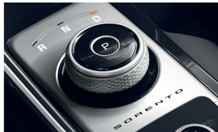
OTOČNÁ HLAVICA RADIACEJ PÁKY

Nová automatická prevodovka ponúka výber režimov jazdy, ktoré vám umožňujú prispôsobiť reakcie hnacej sústavy na vstupy vodiča, čím sa znižuje spotreba paliva alebo zlepšuje zrýchlenie. Model Sorento s naftovým motorom ponúka štyri jazdné režimy: ekologický, komfortný, športový a inteligentný režim, zatiaľ čo model Sorento HEV ponúka ekologický, športový a inteligentný režim. Systém voľby jazdného režimu tiež prispôbuje zaťaženie systému posilňovača riadenia, aby sa dosiahli uvoľnenejšie alebo bezprostrednejšie odozvy riadenia.