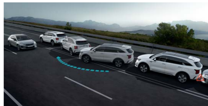
AUTOMATICKÉ NÚDZOVÉ BRZDENIE PO PRVOM NÁRAZE (MCBA)

Je navrhnutý tak, aby pomohol zabrániť cestujúcim na zadných sedadlách opustiť vozidlo, keď systém zistí, že sa blíži potenciálne nebezpečenstvo. Ak k tomu dôjde, systém aktivuje zamykanie a vydá zvukové a vizuálne upozornenie.