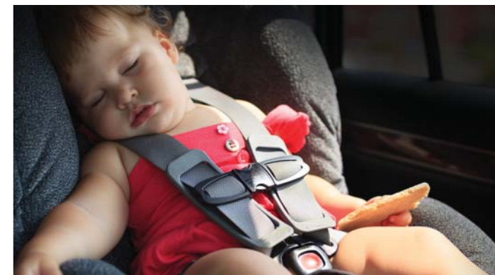
SYSTÉM MONITOROVANIA ZADNÝCH SEDADIEL PRI OPÚŠŤANÍ VOZIDLA (ROA)

Ak sa airbag aktivuje v dôsledku primárnej kolízie, do systému elektronického riadenia stability sa okamžite odošle signál na zabrzdzenie vozidla. Systém MCBA aktivuje brzdy, aby sa zabránilo následnej kolízii alebo aby sa zmiernil jej vplyv.