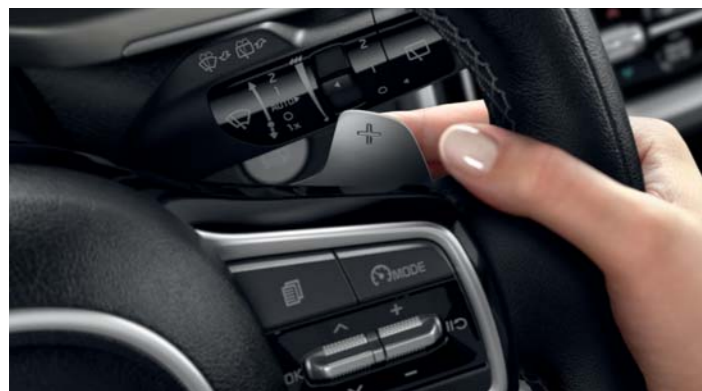
RADIACE PÁČKY PREVODOVKY POD VOLANTOM

Vydajte sa svojou vlastnou cestou vďaka najnovšej ponuke dynamických motorov. Úplne nové päťmiestne a sedemmiestne modely Sorento sú vybavené elektrifikovaným benzínovým motorom 1,6 T-GDi HEV s pohonom všetkých kolies. K dispozícii je tiež naftový motor 2,2 CRDi s pohonom všetkých kolies.