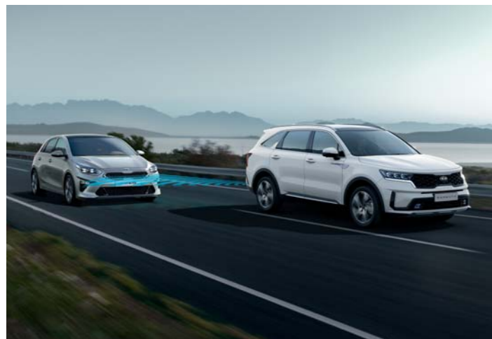
SYSTÉM MONITOROVANIA MŔTVEHO UHLA S ASISTENTOM NA PREDCHÁDZANIE BOČNÝM ZRÁŽKAM (BCA)

Nikto nevie, čo nás čaká na ceste pred nami. Z tohto dôvodu sa nový model Sorento dodáva s mimoriadne prepracovanými riešeniami pre bezpečnejšiu jazdu.