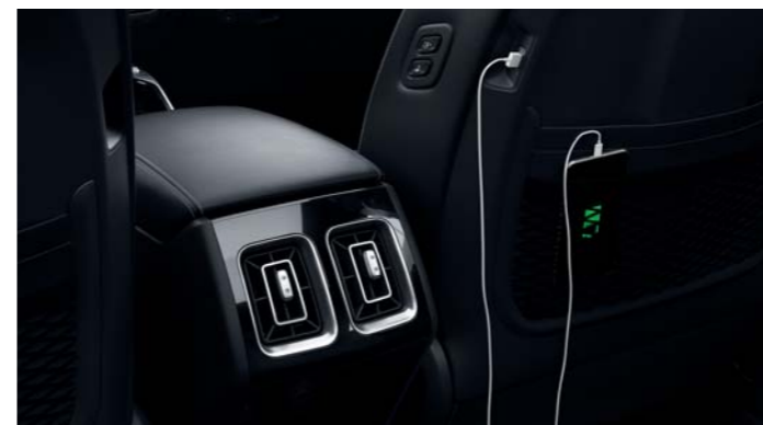
USB PORTY A NABÍJANIE PRE VŠETKY ZARIADENIA

Zažite tú najlepšiu zábavu v aute vďaka dvanástim reproduktorm, externému zosilňovaču a špičkovej technológii. Zmeňte akýkoľvek stereofónny alebo viackanálový zvukový zdroj na ohromujúci zážitok z priestorového zvuku.