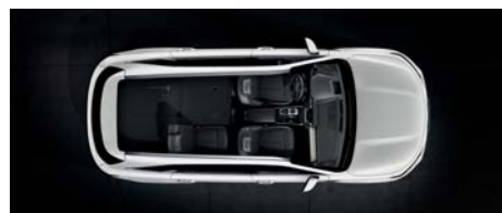
Úplne sklopený 3. rad a čiastočne sklopený 2. rad