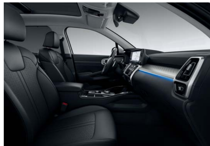
KOŽENÉ ČALÚNENIE SEDADIEL (PRE VÝBAVU GOLD)