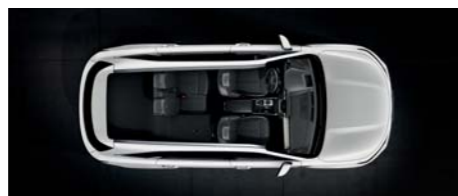
Čiastočne sklopený 2. rad (5-miestna verzia)