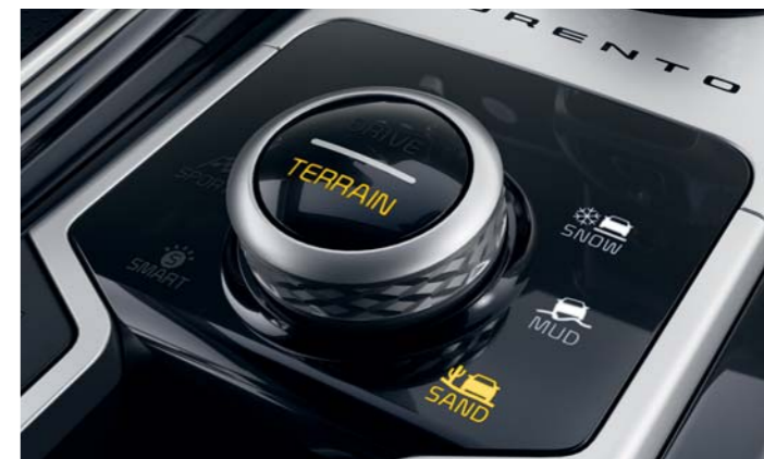
VOĽBA REŽIMU TERÉNU (TMS)

Modely Sorento 1,6 T-GDi HEV a 1,6 T-GDi PHEV sa dodávajú so šesťstupňovou automatickou prevodovkou, ktorá zaisťuje plynulý prechod počas radenia prevodových stupňov.