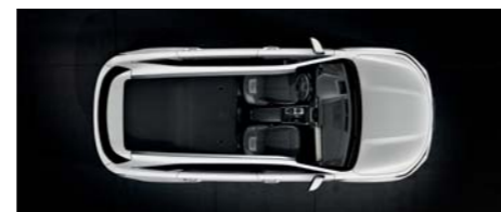
Úplne sklopený 2. rad (5-miestna verzia)

Model Sorento je pripravený, bez ohľadu na to, čo plánujete alebo čo potrebujete prepraviť.