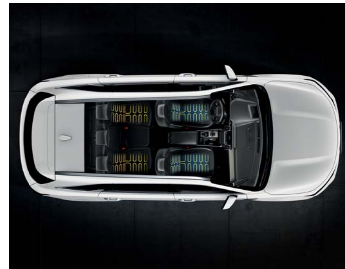
VYHRIEVANÉ A VENTILOVANÉ SEDADLÁ

Pomocou integrovaného pamäťového systému môžu až dvaja vodiči nastaviť svoje preferencie týkajúce sa zrkadiel a sedadiel. Pre väčší komfort a pohodlie sú sedadlá vodiča a spolujazdca vybavené bedrovou opierkou. Sedadlo vodiča má navyše výsuvný sedák s integrovaným airbagom, ktorý bráni kontaktu hlavy vodiča a spolujazdca v prípade kolízie.