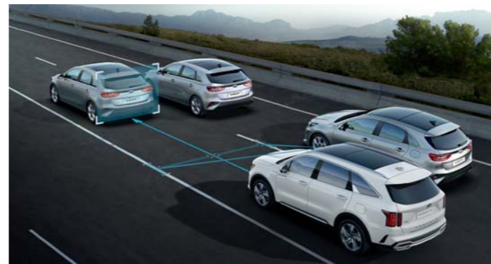
ASISTENT SLEDUJÚCI JAZDNÉ PRUHY VRÁTANE FUNKCIE JAZDY V DOPRAVNÝCH ZÁPCHACH (LFA)

Systém DAW monitoruje volant, smerové svetlá a zrýchlenie a upozorní vás, ak strácate koncentráciu. Systém DAW vás upozorní, ak napríklad v premávke auto pred vami odíde a vy sa nepohnete, alebo ak vykazujete známky ospalosti, vyzve vás, aby ste si urobili prestávku.