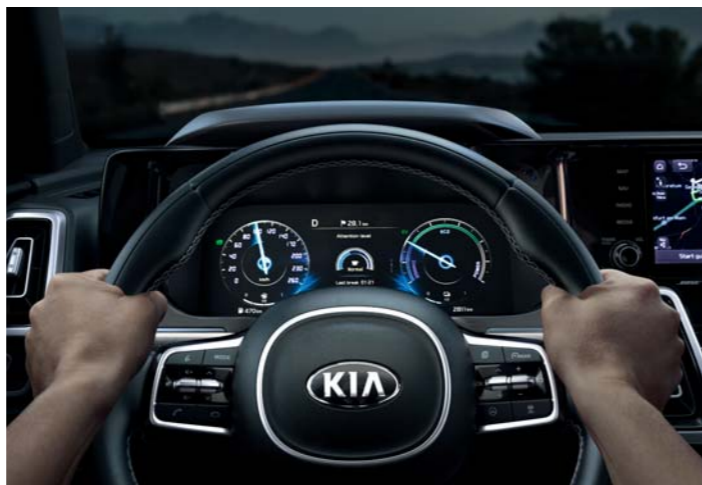
SYSTÉM SLEDOVANIA POZORNOSTI VODIČA (DAW)

Keď to podmienky dovoľia, model Sorento automaticky zapne svoje diaľkové svetlá. Keď kamera na čelnom skle zaznamená svetlomety protiidúceho vozidla v noci, asistent diaľkových svetiel automaticky prepne na stretávacie svetlá, aby zabránil oslneniu ostatných vodičov.