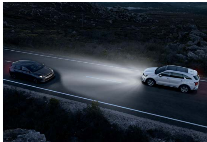
ASISTENT PRE AUTOMATICKÉ PREPÍNANIE DIAĽKOVÝCH SVETIEL (HBA)

Bez ohľadu na to, či je vaša jazda dlhá alebo krátka, je dobré vedieť, že pri každej jazde vaša Kia Sorento pomáha udržiavať vás a vašich cestujúcich v bezpečí.