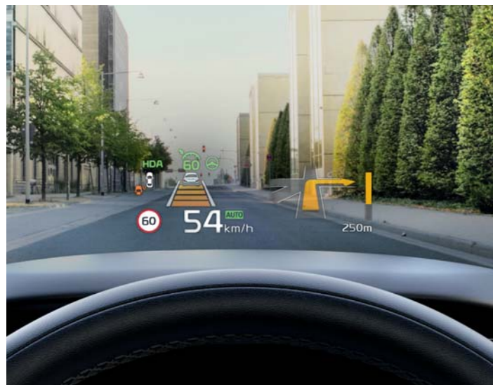
HEAD-UP DISPLAY (HUD)

Keď viete, kam idete, je tiež skvelé vedieť, že vaši blízki môžu zdieľať zážitok z jazdy v ergonomicky navrhnutej, priestrannej a pohodlnej kabíne modelu Sorento.