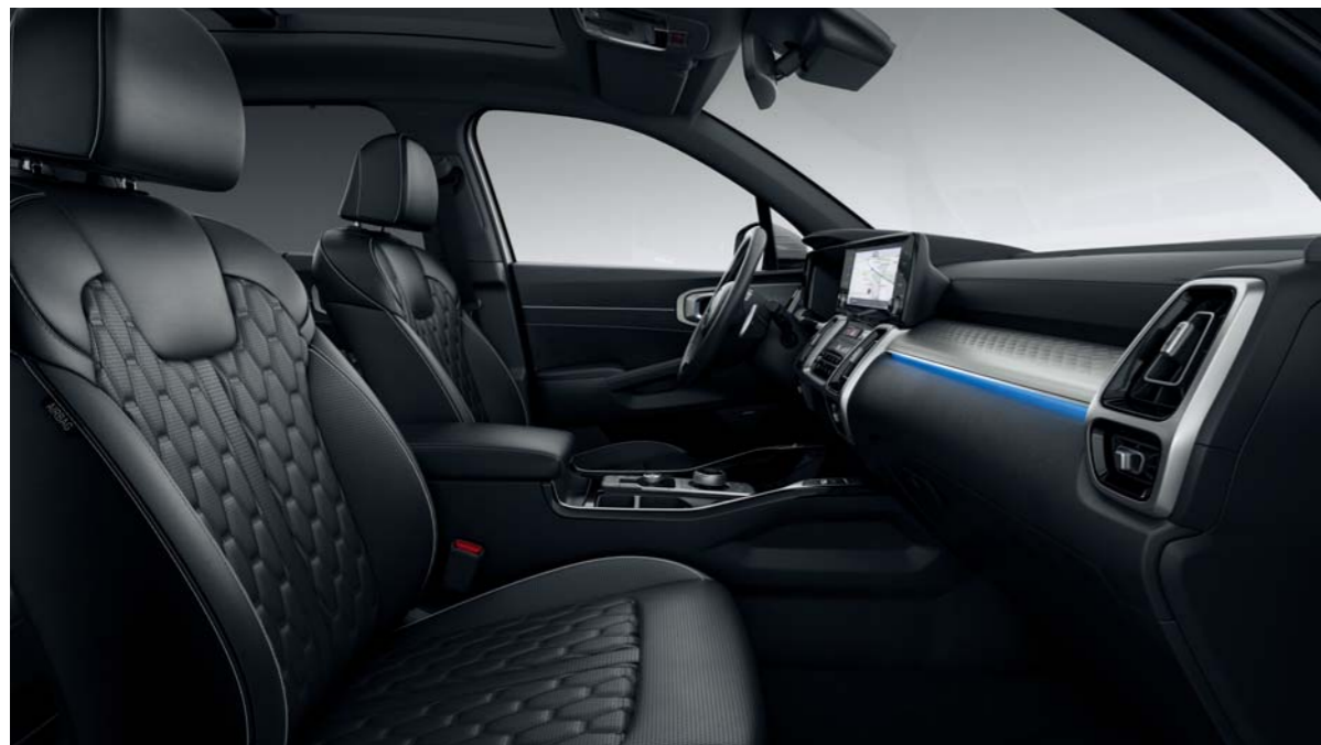
ČALÚNENIE SEDADIEL - JEMNÁ KOŽA NAPPA (PRE VÝBAVU PLATINUM)

Všetky kožené sedadlá sa dodávajú s brúsenou ozdobnou fóliou TOM a 3D nápisom, zatiaľ čo sedadlá z čiernej látky sa dodávajú s ozdobnými prvkami vo farbe kovu s 3D nápisom. Navyše si môžete vybrať ohromujúce čierne kožené sedadlá s čiernymi jednofarebnými prvkami. Sedadlá z čiernej jemnej kože sú doplnené čiernym čalúnením interiéru.