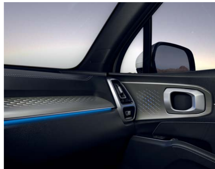
AMBIENTNÉ OSVETLENIE PALUBNEJ DOSKY

Úplne zabezpečenie: tento intuitívny systém kombinuje štyri širokouhlé zábery z kamier na prednej, zadnej a bočných stranách vozidla, aby vám poskytol komplexný pohľad zhora na priestor okolo modelu Sorento pri parkovaní alebo pohybe rýchlosťou nižšou ako 20 km/h.