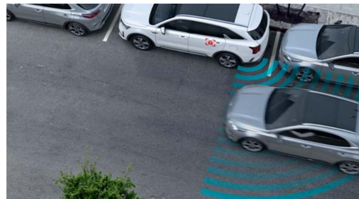
ASISTENT NA BEZPEČNÉ OPUSTENIE VOZIDLA (SEA)

Systém BVM je navrhnutý tak, aby sa zlepšila viditeľnosť mŕtvych uhlov. Používa bočné kamery, takže keď aktivujete ľavé alebo pravé smerové svetlo, váš prístrojový panel zobrazí pohľad na cestu vo vašom mŕtvom uhle. Ak aktivujete ľavé smerové svetlo, zobrazí sa pohľad zozadu z ľavej strany. Ak aktivujete pravé smerové svetlo, zobrazí sa pohľad sprava.