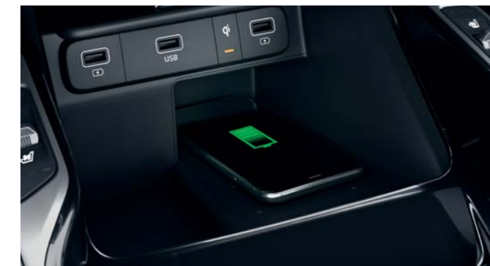
BEZDRÔTOVÉ NABÍJANIE TELEFÓNŮV

Obe operadlá sedadiel v prvom rade majú integrované nabíjacie USB porty na použitie pre cestujúcich v prvom a druhom rade. Batožinový priestor navyše obsahuje dva nabíjacie USB porty na každej strane na použitie pre cestujúcich v treťom rade. Zadná stredová konzola má navyše nabíjací USB port a 12 V zásuvku, čo je ideálne na hranie hier a nabíjanie.