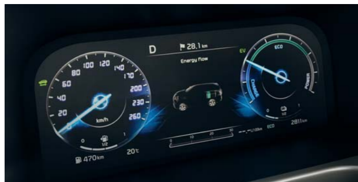
PLNE DIGITÁLNY 12,3" PRÍSTROJOVÝ PANEL SUPERVISION

Regeneratívne brzdenie systému využíva každé spomalenie vozidla – zachytáva energiu a ukladá ju do akumulátora na ďalšie použitie.