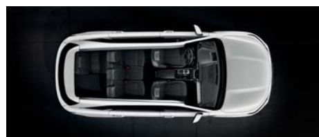
Čiastočne sklopený 3. rad

Model Sorento je možné rýchlo zmeniť z päťmiestneho na sedemmiestny, ako aj jednoducho prekonfigurovať tak, aby sa zmenil na vozidlo s batožinovým priestorom s objemom až 910 litrov. Pre ľahké sklopenie operadiel sedadiel v druhom rade priamo z oblasti batožinového priestoru sú k dispozícii dve tlačidlá diaľkového sklápania jedným dotykom, jedno pre sklopenie ľavého sedadla a druhé pre sklopenie pravého sedadla, aby sa táto činnosť dala vykonať rýchlo a jednoducho.