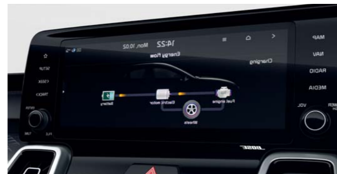
10,25" DISPLEJ NAVIGAČNÉHO SYSTÉMU

Inteligentne navrhnutý a prispôsobiteľný prístrojový panel Supervision zobrazuje informácie o teplote, upozornenia na tlak v pneumatikách a ďalšie dôležité informácie o vozidle a jazde. Tiež zobrazuje stav hybridného nabíjacieho systému vrátane stavu paliva a batérie a spotreby. Obrazovka s vysokým rozlíšením umožňuje pri rýchlom pohľade jednoducho prečítať množstvo informácií.