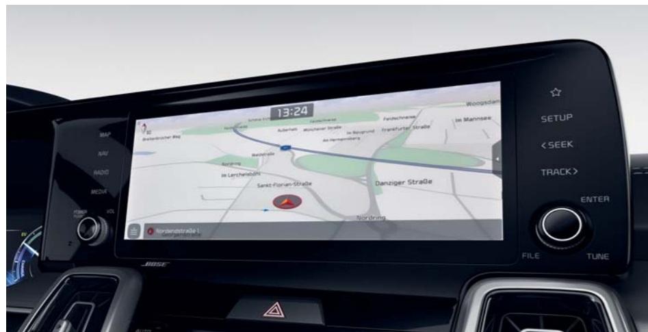
NAVIGAČNÝ SYSTÉM S 10,25" LCD DOTYKOVOU OBRAZOVKOU

Od chvíle, keď si sadnete do nového modelu Kia Sorento, objavíte rad najnovších informačných a zábavných technológií navrhnutých tak, aby ste mali úplnú kontrolu nad tým, aké dobrodružstvá ležia pred vami.