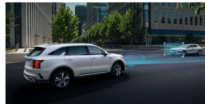
ASISTENT NA PREDCHÁDZANIE ČELNÝM ZRÁŽKAM (FCA)

Používa ultrazvukové senzory určené na detekciu detí alebo domácich zvierat v druhom alebo treťom rade sedadiel a poskytuje vizuálne a zvukové výstrahy, ak zistí pohyb vo vnútri, a to pred a po zamknutí vozidla.