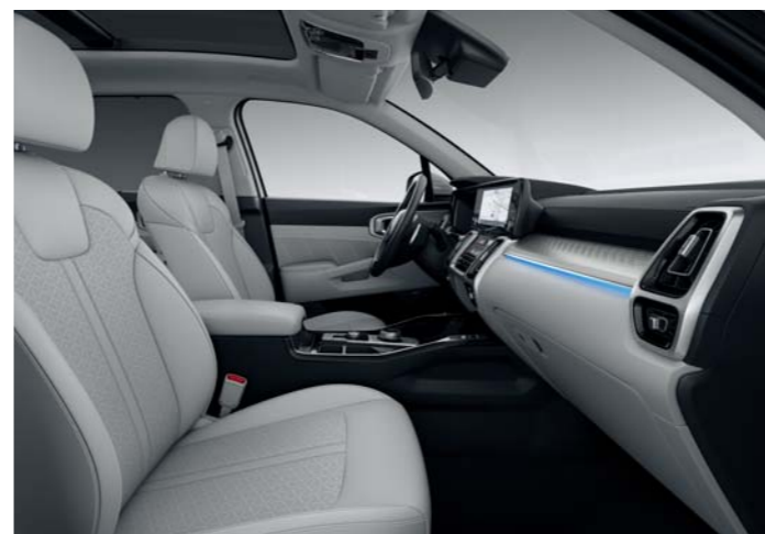
KOŽENÉ ČALÚNENIE SEDADIEL ŠEDÉ (PRE VÝBAVU GOLD)