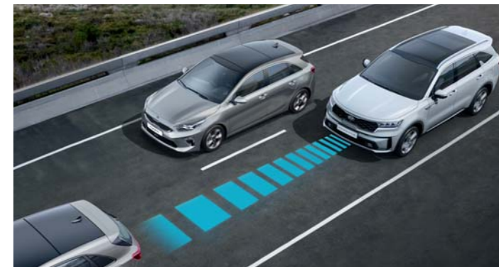
SMART ADAPTÍVNY TEMPOMAT S FUNKCIOU STOP & GO

Adaptívny tempomat pomocou kamery a radaru udržiava nastavenú rýchlosť a zaisťuje bezpečnú vzdialenosť medzi vaším vozidlom a vozidlom pred vami. Taktiež ovláda zrýchľovanie a spomaľovanie, aby sa zabezpečilo zastavenie vozidla pri zastavení vozidla pred vami a následný rozjazd, keď sa druhé vozidlo znova pohne. Adaptívny tempomat je navyše podporovaný navigáciou a využíva informácie mapy, čo mu umožňuje automaticky znížiť rýchlosť v zákrutách, aby sa zvýšila bezpečnosť a dodržiavanie rýchlostného obmedzenia.