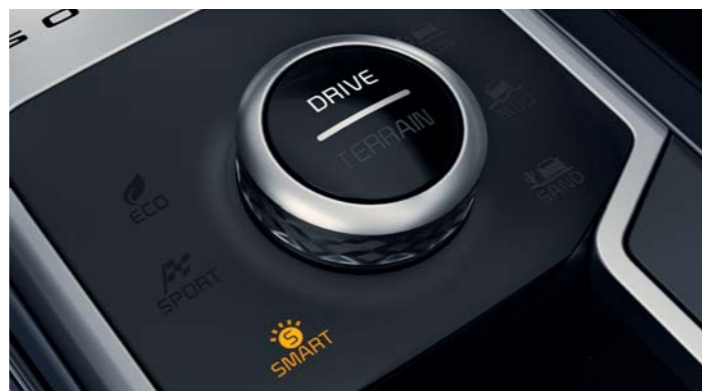
VOLIČ JAZDNÝCH REŽIMOV (DMS)

Vylepšené, chrómované páčky na radenie rýchlostí sú v súlade so zvyšným dizajnom kabíny a umožňujú vám rýchlo radiť prevodové stupne bez toho, aby ste zložili ruky z volantu. Taktiež zvyšujú dynamiku jazdy, vďaka čomu môžete bez námahy rýchlo zvýšiť krútiaci moment a zároveň mať všetko pod kontrolou.