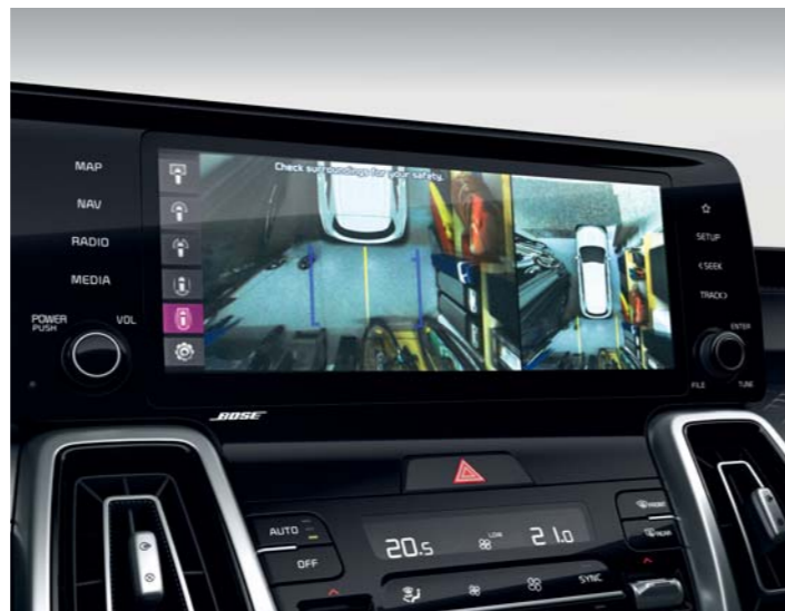
360° PARKOVACIA KAMERA

Zostaňte v bezpečí: head-up displej udrží váš zrak na ceste vďaka tomu, že premietá grafické prvky a ďalšie informácie súvisiace s jazdou na čelné sklo priamo do vášho zorného poľa.