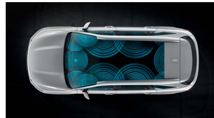
PRÉMIOVÝ ZVUKOVÝ SYSTÉM BOSE®

V rámci nášho rozsiahleho prísľubu kvality majú všetky nové vozidlá Kia, ktoré sú z výroby vybavené navigačným zariadením LG, nárok na šesť bezplatných ročných aktualizácií máp v servisnom mieste. Tento jedinečný program je zárukou, že svoj navigačný systém budete mať stále aktuálny.