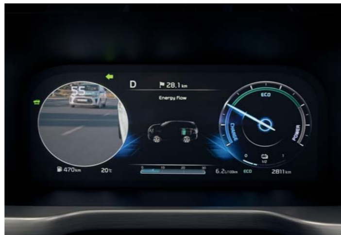
ZOBRAZOVANIE MŔTVEHO UHLA NA PRÍSTROJOVOM PANELI (BVM)

Ak chcete zmeniť jazdný pruh, systém monitorovania mŕtveho uhla s asistentom na predchádzanie bočným zrážkam deteguje každé vozidlo(-á) vo vašom mŕtvom uhle a upozorní vás výstražným symbolom v spätnom zrkadle a head-up displeji vo vnútri vozidla. Ak začnete meniť jazdný pruh, keď sa vo vašom mŕtvom uhle nachádza vozidlo, Sorento automaticky aktivuje brzdy, aby zabránilo kolízii, začnú blikať výstražné symboly na spätných zrkadlách i na head-up displeji a zaznie zvukový signál.