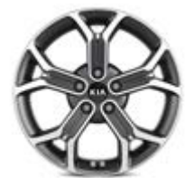
235/45R18-palcové disky kolies z ľahkých zliatin / Platinum