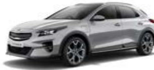
Sparkling Silver (metalický lak)