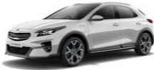
Deluxe White (metalický lak)