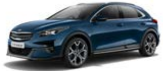
Cosmos Blue (metalický lak)