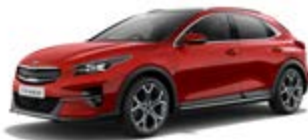
New Infra Red (metalický lak)