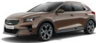
Cooper Stone (metalický lak)