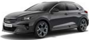
Penta Metal (metalický lak)