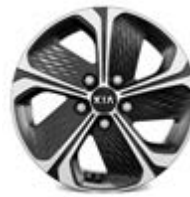
205/60R16-palcové disky kolies z ľahkých zliatin / Gold