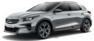
Lunar Silver (metalický lak)