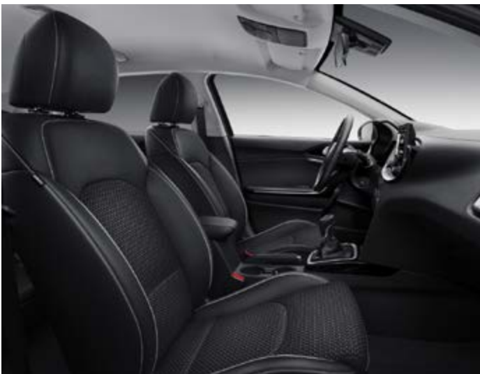
Čierna látka / koža