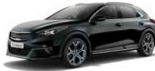
Black Pearl (metalický lak)