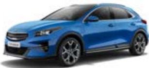
Blue Flame (metalický lak)