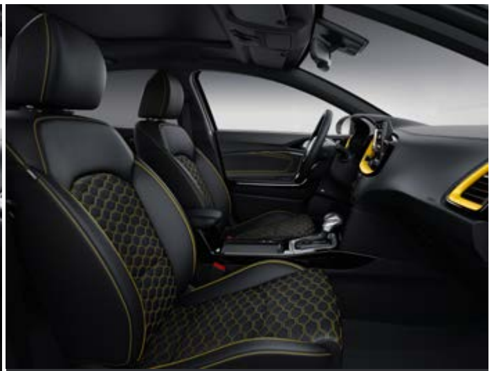
Čierna látka / koža / žlté prešívanie (Yellow Pack)