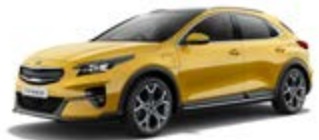
Quantum Yellow (metalický lak)