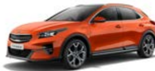
Orange Fusion (metalický lak)