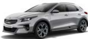
Sparkling Silver (metalický lak)