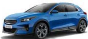
Blue Flame (metalický lak)