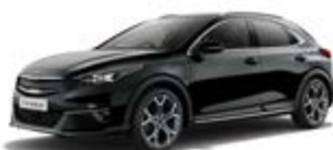
Black Pearl (metalický lak)