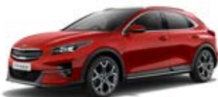
New Infra Red (metalický lak)