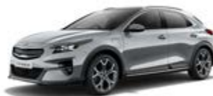
Lunar Silver (metalický lak)