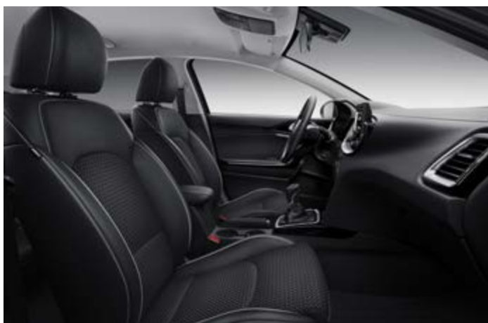
Čierna látka / koža