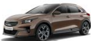
Cooper Stone (metalický lak)