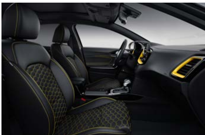
Čierna látka / koža / žlté prešívanie (Yellow Pack)