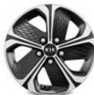
205/60R16-palcové disky kolies z ľahkých zliatin / Gold