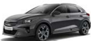
Penta Metal (metalický lak)