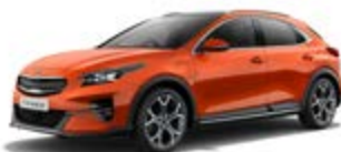
Orange Fusion (metalický lak)