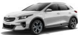
Deluxe White (metalický lak)