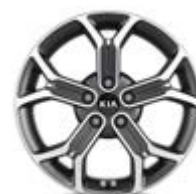
235/45R18-palcové disky kolies z ľahkých zliatin / Platinum