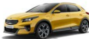
Quantum Yellow (metalický lak)