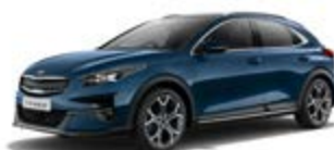
Cosmos Blue (metalický lak)